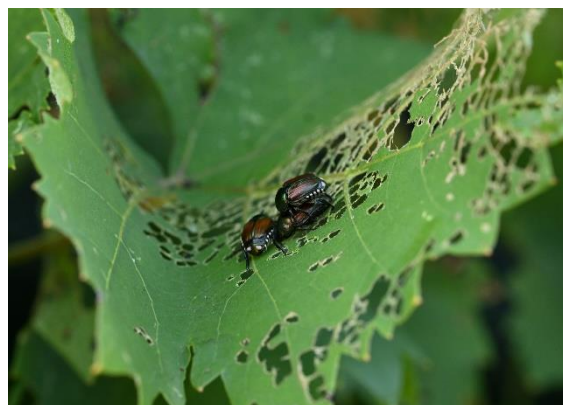
Figura 6. Adulti di Popillia japonica mentre si alimentano su foglia di vite, causando le caratteristiche erosioni fogliari.

L'elenco delle piante ospiti è consultabile alla pagina web https://gd.eppo.int/taxon/POPIJA/hosts .