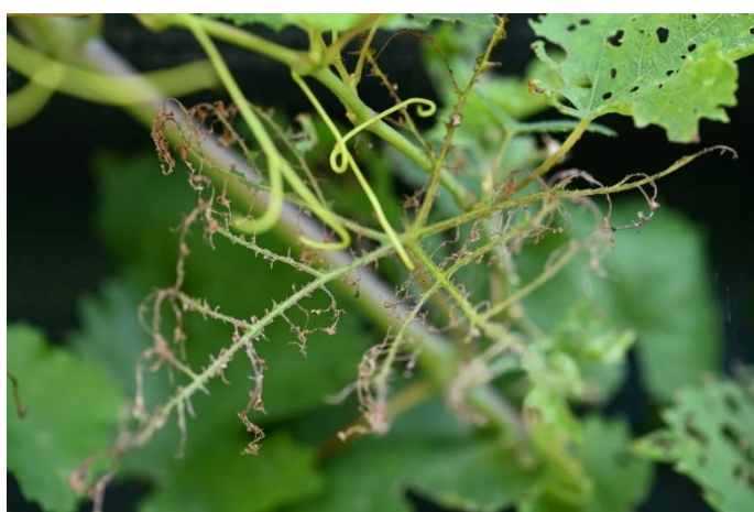
Figura 5. Foglia di vite completamente scheletrizzata da Popillia japonica

Adulti: colpiscono prevalentemente le foglie ma possono arrecare gravi danni anche a fiori e frutti. Gli adulti di Popillia japonica hanno un comportamento spiccatamente gregario in quanto fortemente attirati dai cairomoni prodotti dalla vegetazione danneggiata dai primi individui giunti sulle piante. In caso di elevata densità di popolazione del fitofago, le foglie colpite restano scheletrizzate, con la sola venatura centrale ancora integra, mentre fiori e frutti possono risultare completamente distrutti.