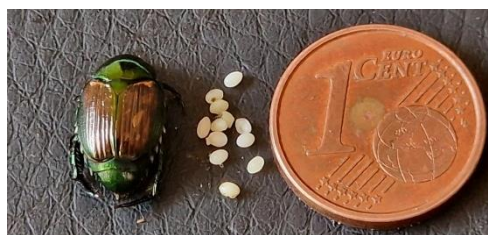
Figura 2. Adulto e uova di Popillia japonica messi a confronto con una moneta da 1 centesimo.

Hanno la caratteristica forma a “C” tipica delle larve degli Scarabeidi, con capo bruno giallastro e corpo di colore bianco-crema, ricoperto di peli marroni. Lo sviluppo post-embryonale è caratterizzato da tre età larvali, l'ultima delle quali sverna nel terreno ad una profondità di 10-20 cm per