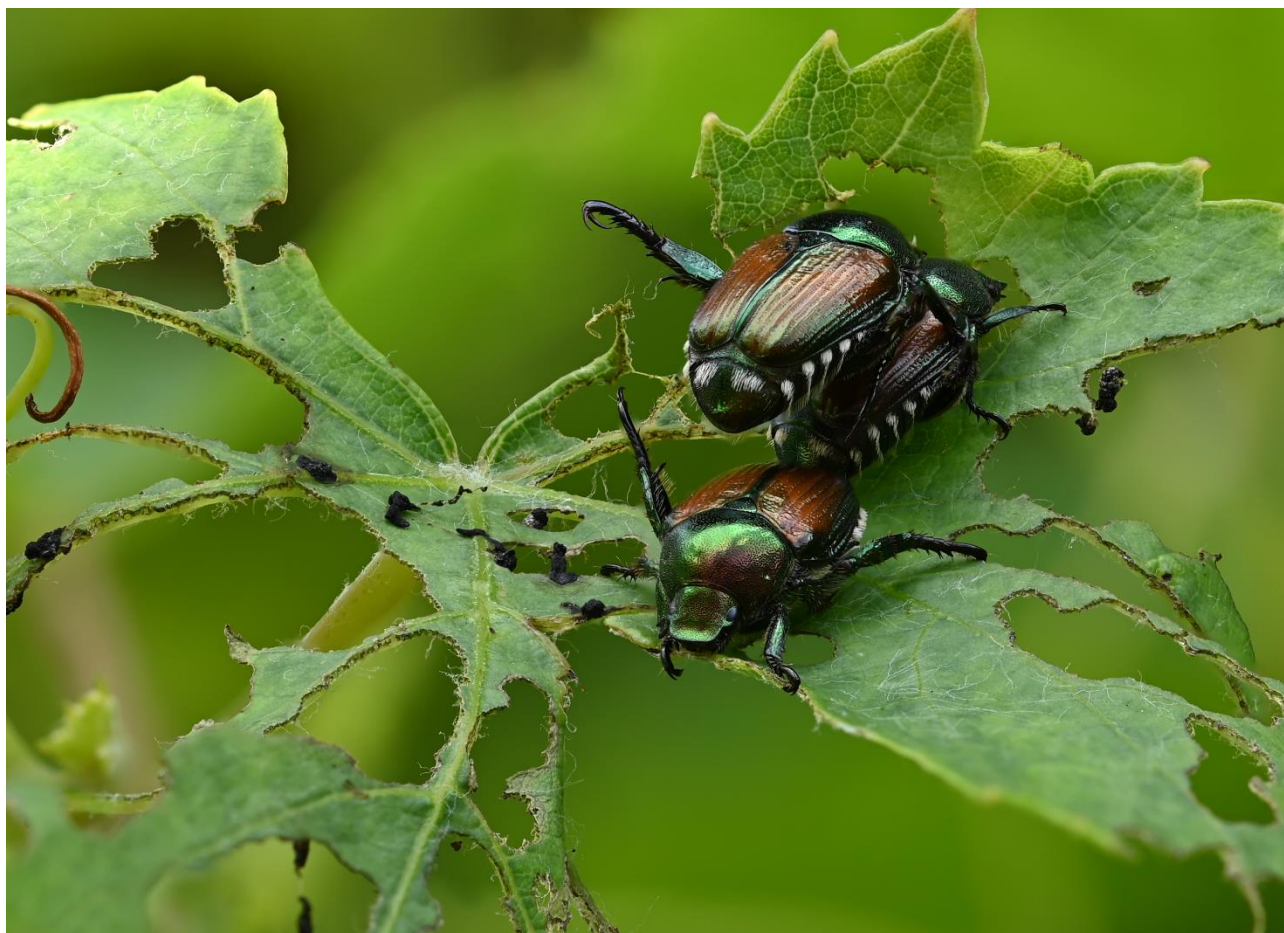
Figura 1. Adulti di Popillia japonica su foglia di vite

Ordine e famiglia: Coleoptera, Scarabaeidae.