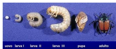
Figura 3. Stadi di sviluppo di Popillia japonica .