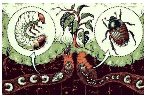
Figura 4. Schema del ciclo di Popillia japonica .

Nei nostri areali Popillia japonica compie una sola generazione all'anno: nel mese di maggio le larve di terza età si impupano nel terreno, dando luogo nel periodo tra giugno e agosto allo sfarfallamento degli adulti, che sopravvivono mediamente per 30-40 giorni, con un picco degli sfarfallamenti verso la metà di luglio. In estate le femmine depongono le uova direttamente nel terreno, preferibilmente umido, singolarmente o in piccoli gruppi, talvolta in piccole gallerie scavate nei primi 10 cm di suolo. In media una femmina depone 50 uova.